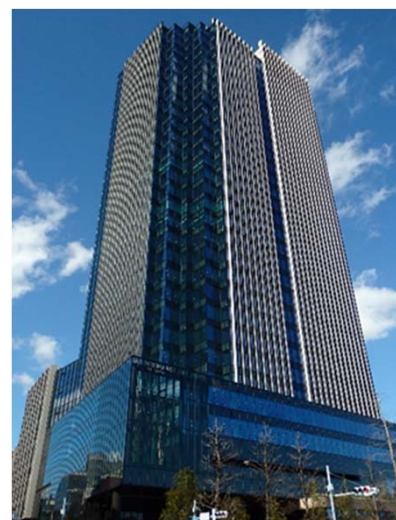
コモレ四谷 四谷タワー

お問い合わせ先 理研ビタミン株式会社 広報・IR室 井上・清水 TEL:03-5275-5835